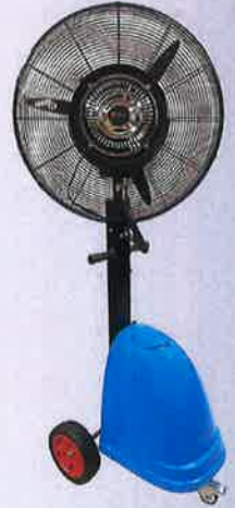
PM-660MFZ 遠心分離式ミストファン