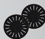
シリコンアタッチメント×2