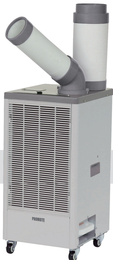
スポットクーラー D410-A