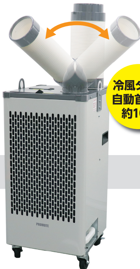
スターディススポットクーラー 自動首振り機能付 D410-SC